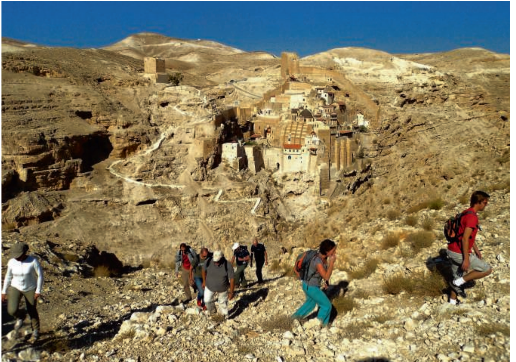
Wandeling langs het Mar Saba klooster in de Woestijn van Judea op de Westelijke Jordaanoever.

Het is niet de eerste gedachte die bij je opkomt als je aan de Palestijnse gebieden denkt, maar het blijkt een machtig mooi gebied om te wandelen. In het noorden zijn fraaie mediterrane heuvels, in het midden kun je door die-